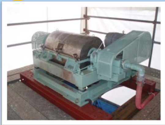
仮設脱水機 汚泥 処理前